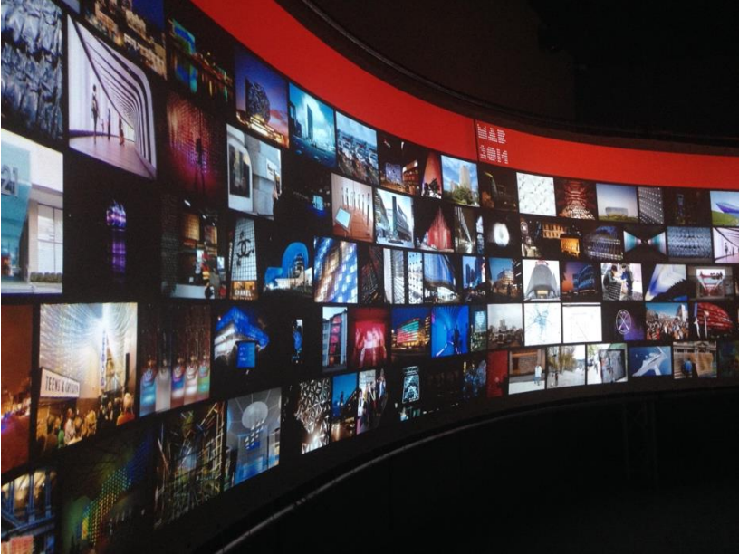
Panorama van urban screens. Media Architecture Biennale, 2014