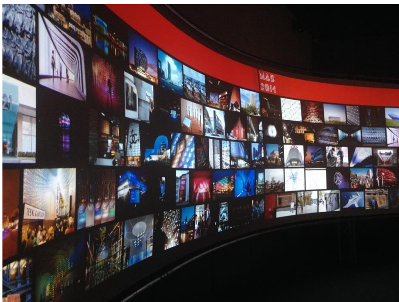
Panorama van urban screens. Media Architecture Biennale, 2014