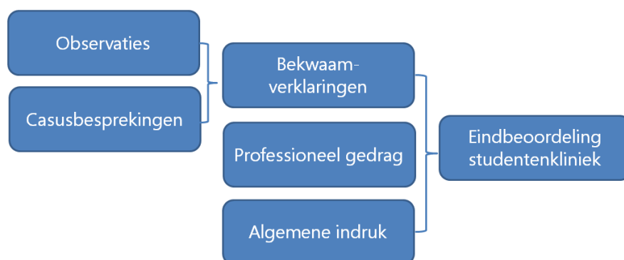
Figuur 3 Systematische weergave van de beoordelingssystematiek in de studentenklinieken

Verder is minimaal een 'behoeft aandacht' nodig voor professioneel gedrag. Daarnaast wordt de algemene indruk die de coassistent heeft achtergelaten tijdens de stage in de beoordeling meegenomen (zie ook figuur 3 en tabel 4 kaders eindbeoordeling studentenklinieken). In tabel 6 op pagina 19 is te zien welke professional op de werkvloer welke beoordeling mag doen.